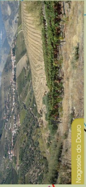
Nagoselo do Douro