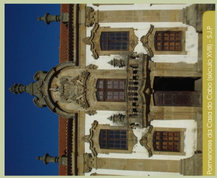
Portões da Casa do Cabo (século XVIII) - S.J.P