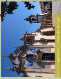
Praça da República - S. João da Pesqueira