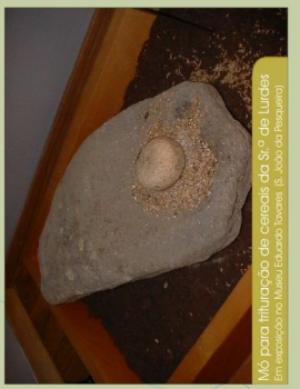
Mó para trituração dos cereais do S.º de Lurdes (em exposição no Museu Etnográfico, Parque do Vale do Douro)